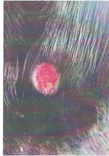
गिर्खा फुटेपछिको घाउ

थप जानकारीका लागि पशु सेवा विभाग, हरिहरभवन फोन नं. ०१-५५२१६१०, ०१-५५२५४७८, ०१-५५२२०५६ वेब: www.dls.gov.np