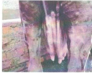
पछाडिको भाग र धुन वरिपरि गिर्खा देखिएको