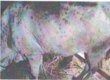
शरीरभरि गिर्खा देखिएको गाई