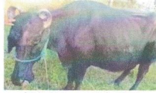
भैसीको शरीरभरि साना साना गिर्खाहरू देखिएको